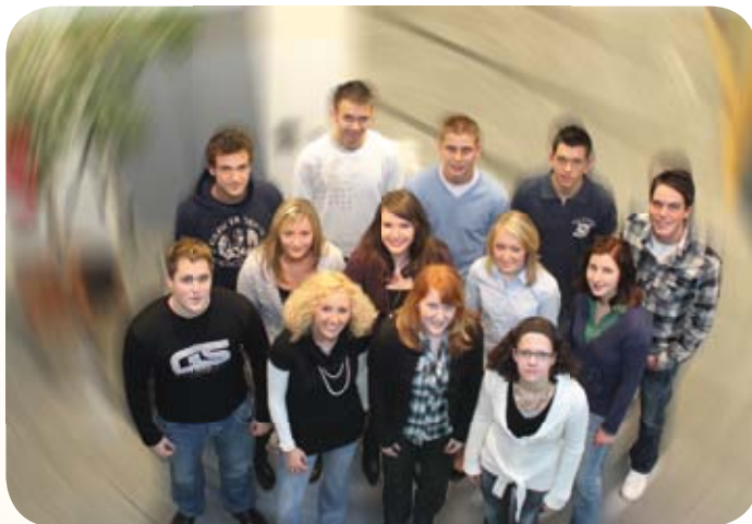
Die Auszubildenden der VR Bank eG